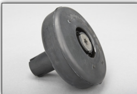
Figura 2: Smorzatore vibrazioni

Sui veicoli sprovvisti di smorzatore vibrazioni è possibile montare il componente con n. OE 24459603 ( Figura 2 ) in un secondo momento.