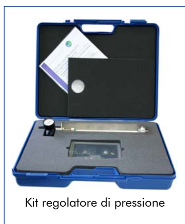
Kit regolatore di pressione