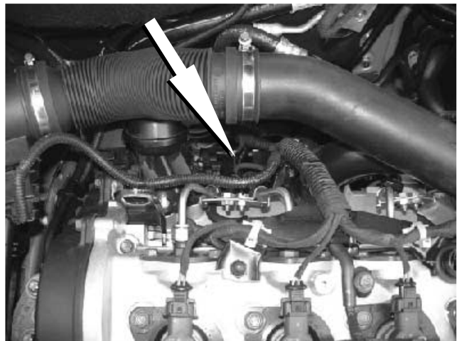
INDIVIDUARE IL SENSORE RAIL