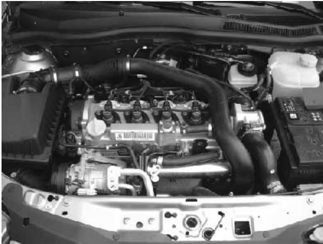
APRIRE IL COFANO E TOGLIERE IL COPERCIO MOTORE