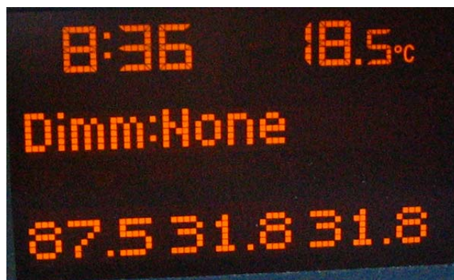
Schermata 5B (fari posizione accesi)