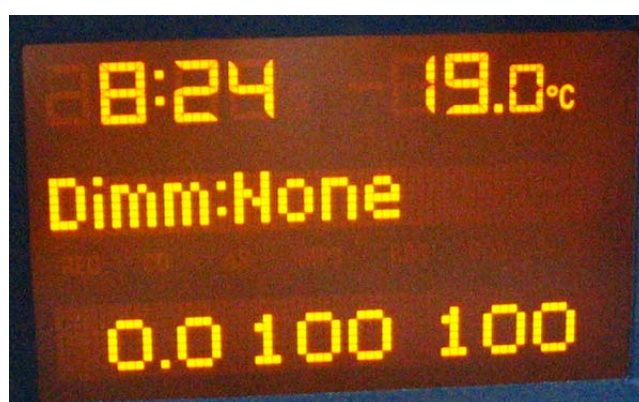
Schermata 5 (tutto spento)