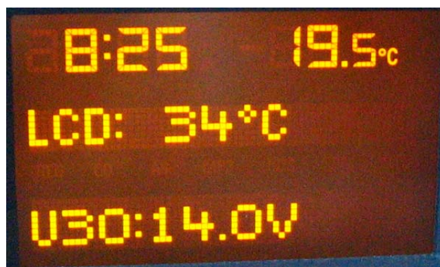
Schermata 6 (linea inferiore: voltaggio batteria)