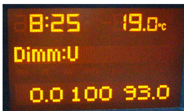
Schermata 5A (motore in moto)