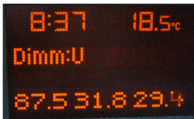
Schermata 5C (fari anabbaglianti accesi)